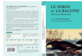
Le Hibou et la Baleine