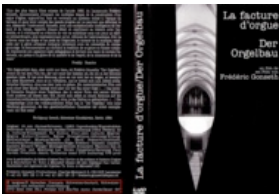
La Facture d'orgue