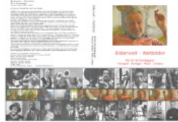
Bilderwelt - Weltbilder