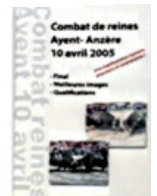
Combat de Reines