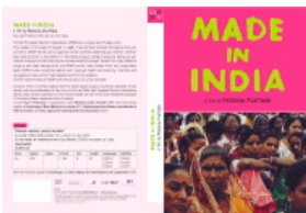
Made In India