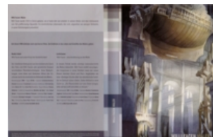
Willi Facen. Maler

Presque tous les nouveaux films suisses, fictions ou documentaires, sortent aussi en DVD. Les producteurs créent des sites internet pour leurs films. Cependant, le problème de la distribution n'est que partiellement résolu et il est très compliqué pour un producteur de vendre des DVD en ligne.