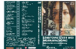
L'Histoire c'est moi